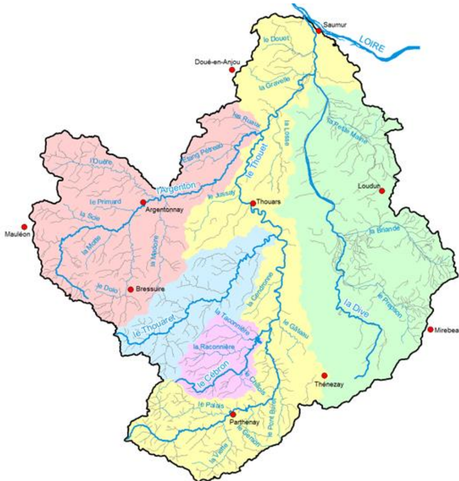
Figure 1 : Le périmètre du SAGE Thouet (SMVT, 2019)

L'Arrêté Inter-Préfectoral du 20 décembre 2010 délimite le périmètre du Schéma d'Aménagement et de Gestion des Eaux du Thouet. En 2020, la SAGE Thouet comprend 2 régions (Nouvelle Aquitaine et Pays de la Loire), 3 départements (Deux-Sèvres, Vienne, Maine-et-Loire), 9 Communautés de Communes et d'Agglomération pour un total de 169 communes. Les communes les plus peuplées du territoire sont Saumur, Bressuire, Parthenay, Thouars, Doué-en-Anjou et Loudun.